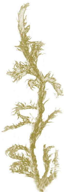
Sphagnum capillifolium (Jean Faubert)