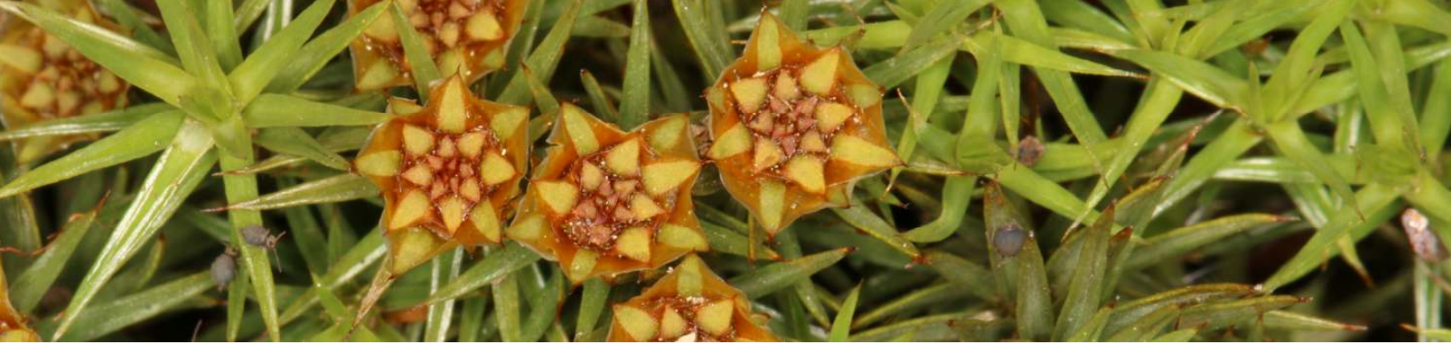
Polytrichum strictum (Jean Faubert)